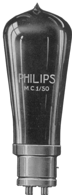
Schaal 1 : 3